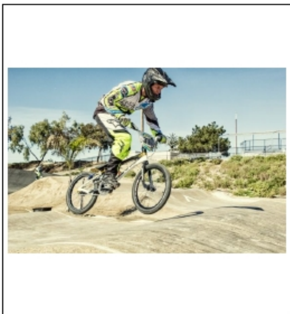
Cycliste de BMX avec l'équipement obligatoire de protection