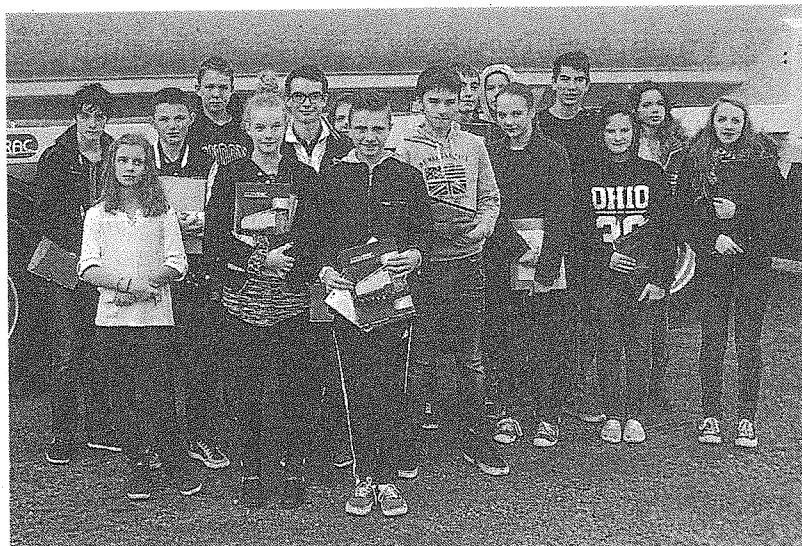
Un groupe de collégiens s'est rendu à l'entreprise Ecovrac.

Dans le cadre de leur projet professionnel, une quinzaine d'élèves du collège Paul-Eluard sont allés, jeudi à Saint-Caradec, pour découvrir de l'entreprise Ecovrac. Ils ont visité les ateliers de construction des semi-re-