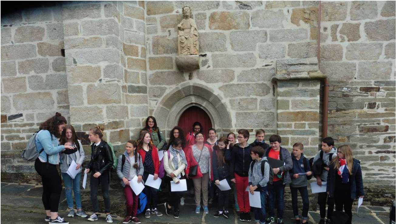
La 5e, option culture bretonne du collège Paul-Éluard, regroupée devant la chapelle Saint-Jacques, à Saint-Léon.